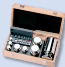
Gewichtsatz M1 Klasse III 10 000e