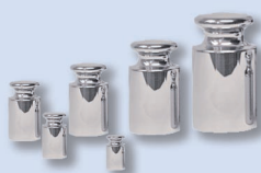
Gewichtstücke M1 Klasse III 10 000e